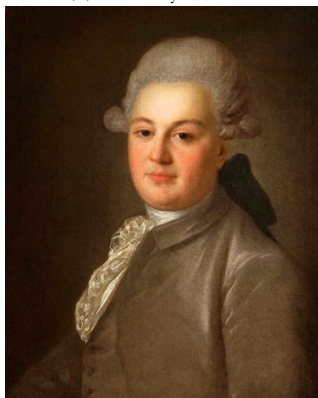
Артемий Иванович Воронцов (1848-1813) Художник Ф.С.Рокотов