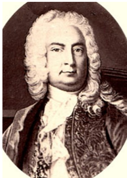
Артемий Петрович Вольнский (1689-1740)

кабинет-министру императрицы Анны Иоанновны. Артемий Петрович Вольнский был замечен Петром I, он выполнял ответственные дипломатические и административные поручения царя. Вплоть до перехода под его владение в 1726 г. другой родовой усадьбы (Вороново под Москвой), основной своей вотчиной А. П. Вольнский считал Батыево. Очень вероятно, что молодые годы (до 15 лет), о которых нет никакой достоверной информации, он провел в Батыево, возможно, что и родился здесь.