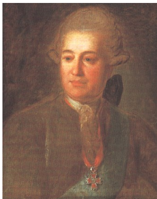
Иван Илларионович Воронцов (1719-1786) Художник Ф.С.Рокотов

Костромского наместничества (1782-1783гг).